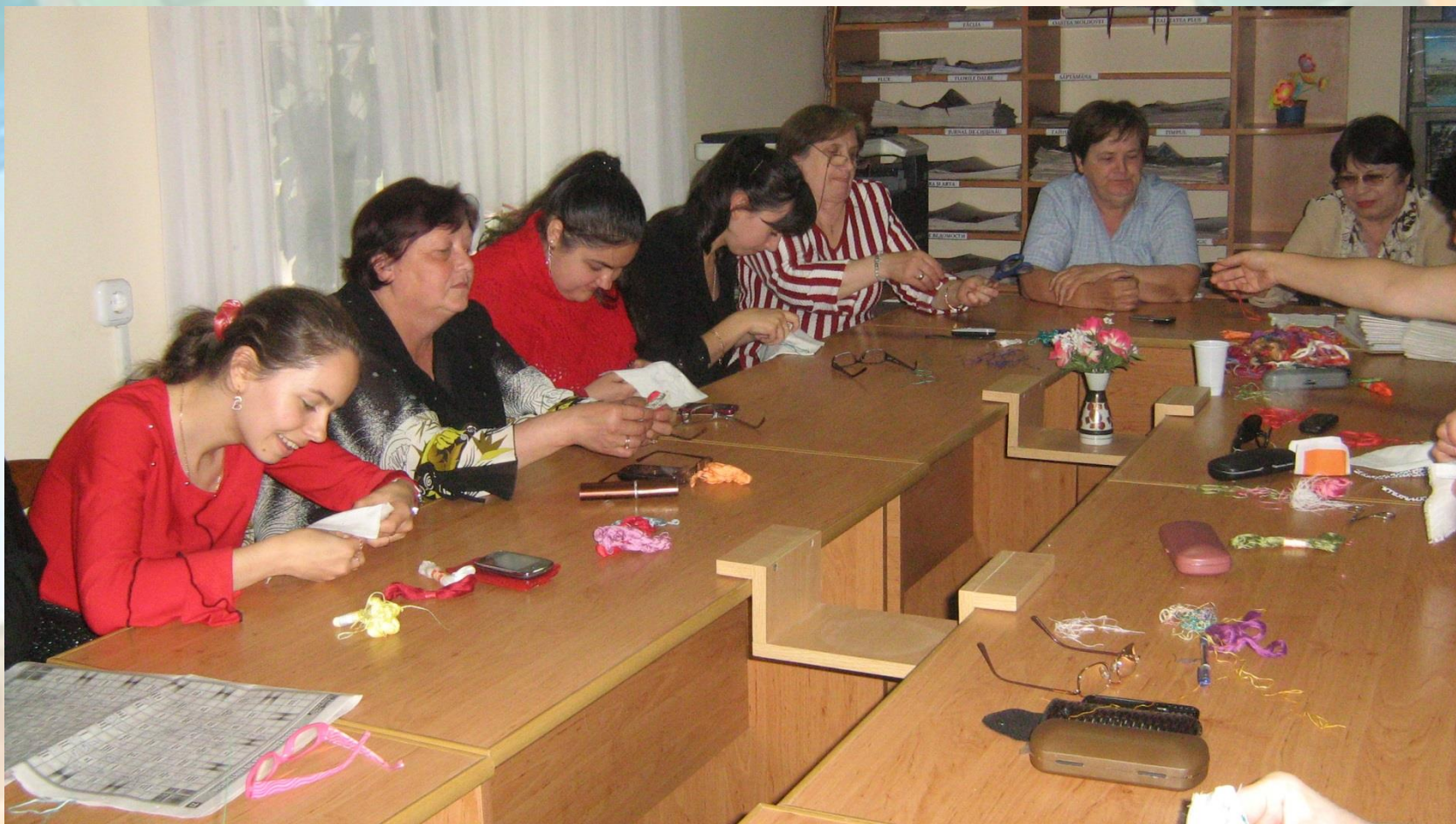
Clubul "Floare albastra"